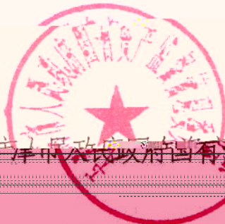
天津市人民政府国有资产监督管理委员会