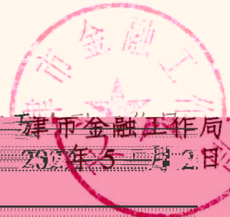
天津市金融工作局