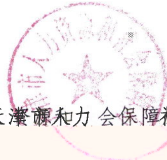
天津市人力资源和社会保障局